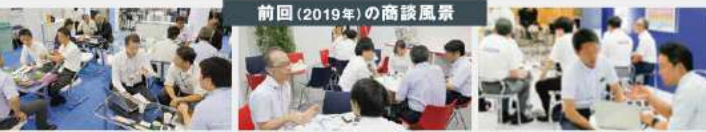
前回(2019年)の商談風景